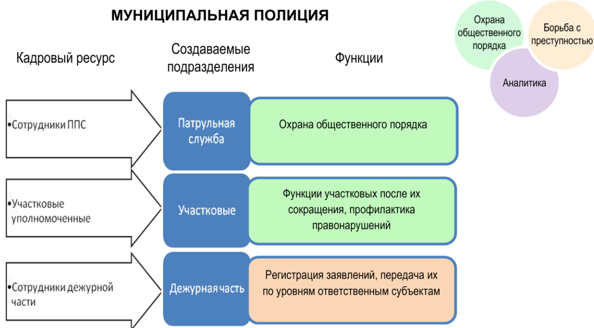
Рисунок 3. Структура и функции муниципальной полиции

Глава муниципальной полиции назначается органом местного самоуправления второго уровня (муниципального района) и проходит профессиональную аттестацию в полиции субъекта федерации. Регламент деятельности принимается органом местного самоуправления муниципалитета в соответствии с рамочным законом «О муниципальной полиции»/«О полиции» и регистрируется в общем порядке Минюстом после проверки на соответствие федеральному закону.