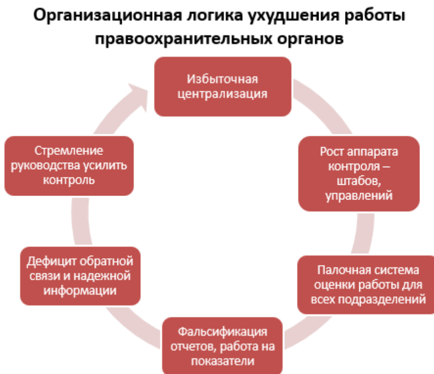
Рисунок 1. Организационная логика ухудшения работы правоохранительных органов

На практике эти факторы взаимодействуют и усиливают друг друга. В совокупности они способствуют ухудшению работы полиции с каждой новой попыткой изменить ситуацию к лучшему. При сохранении сложившейся организационной модели руководство периодически пытается усилить контроль, не решая базовые проблемы; в результате растет управленческий аппарат, он порождает новые отчетные показатели и рост бумажной работы; деятельность подразделений становится еще менее прозрачной для руководства и общества; работа «на показатели» требует новых незаконных практик, и рано или поздно осознается необходимость усилить контроль, что запускает «порочный круг» заново (см. Рисунок 1).