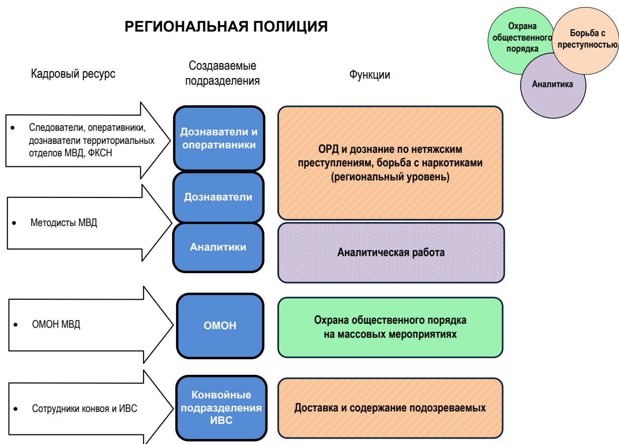
Рисунок 4. Структура и функции региональной полиции

В состав региональной полиции переходит большая часть оперативных служб полиции, дознаватели МВД и ФСКН, а также следователи МВД. На уровне региональной полиции преступления расследуются в форме дознания, под контролем прокуратуры (см. гл. 6.6 о повышении заинтересованности прокуратуры в юридической чистоте расследования дела) 16 . Региональной полиции передается часть силовых структур (ОМОН). Региональная полиция также отвечает за поддержание общественного порядка на крупных мероприятиях, спецобъектах местного и регионального значения. Она организует конвоирование, работу ИВС, оказывает методическую поддержку муниципальным полицейским структурам, возможно, содержит курсы переподготовки для них. Функции ГИБДД/ДПС также передаются на региональный уровень вместе с соответствующими подразделениями. Они отвечают за безопасность на всех трассах и дорогах данного региона (субъекта федерации). Создание регионального уровня необходимо для эффективного получения сведений о структуре преступности, документирования необходимой информации о нераскрытых преступлениях и контроля очевидной преступности.