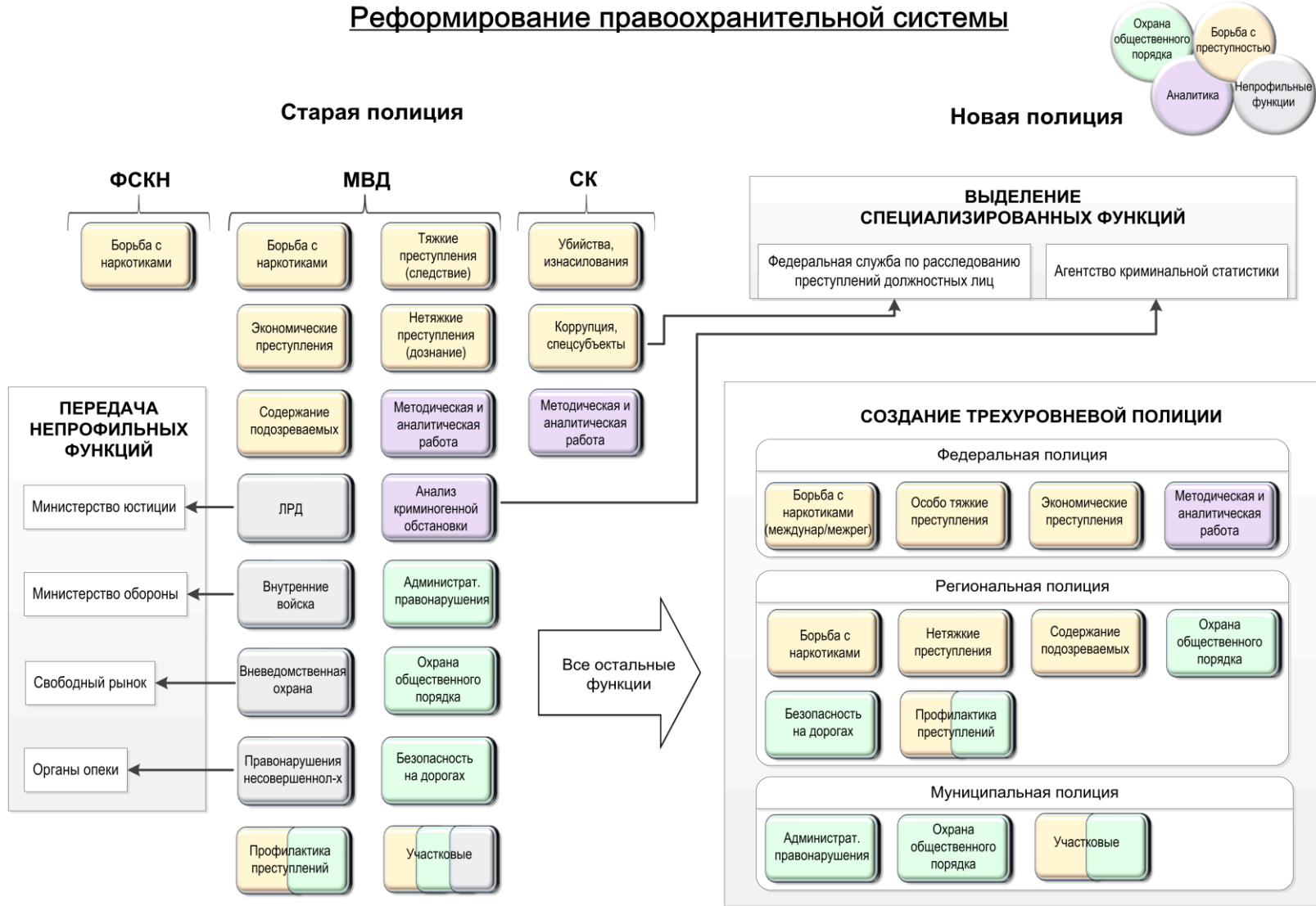
Рисунок 6. Логика реформирования правоохранительной системы